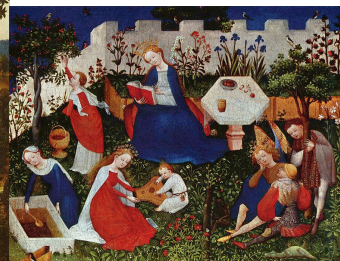
(d) „Rajski ogród”