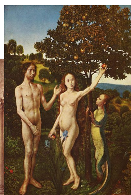
(c) „Upadek”, Hugo van der Goes