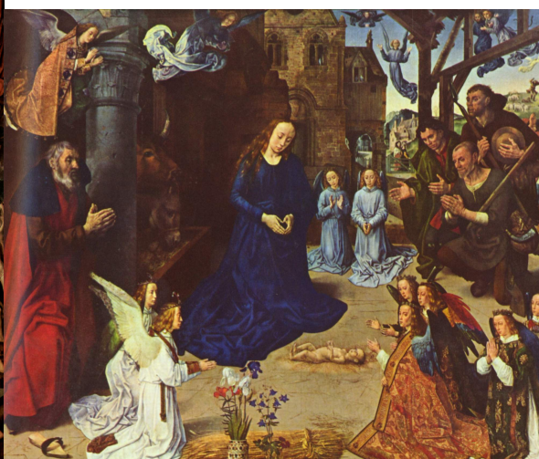
(b) „Narodziny Chrystusa”, Hugo van der Goes