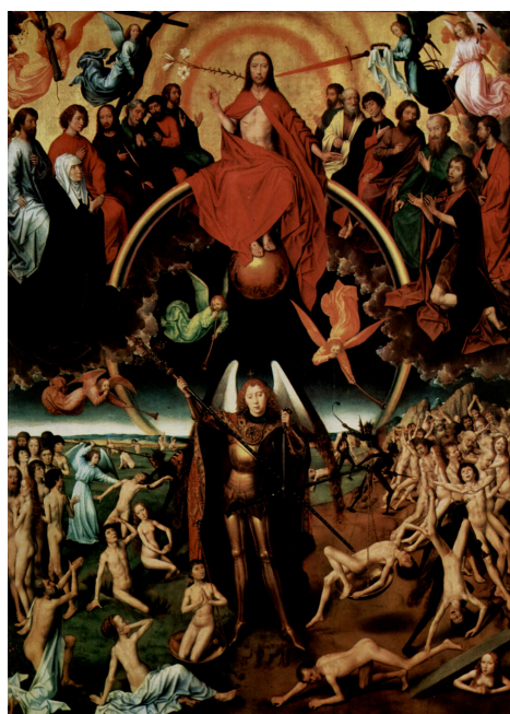
(a) „Sąd Ostateczny” Hans Memling