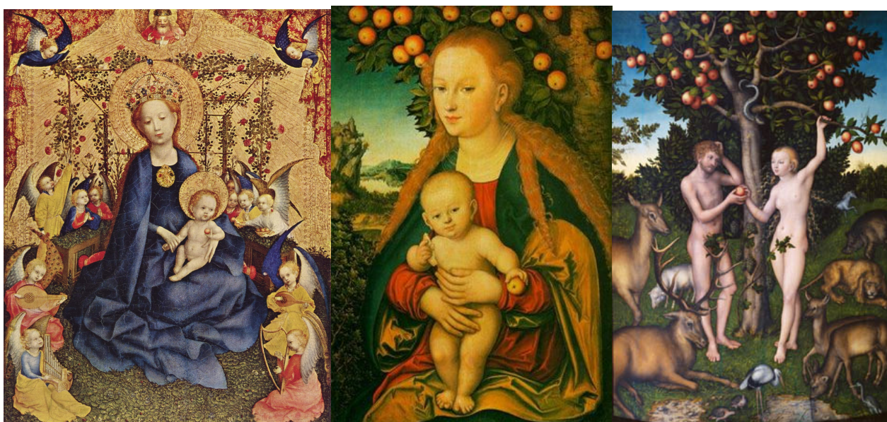
(a) „Madonna w altanie różanej”, Stefan Lochner (b) „Madonna z jabłonią”, Lucas Cranach Starszy (c) „Adam i Ewa”, Lucas Cranach Starszy