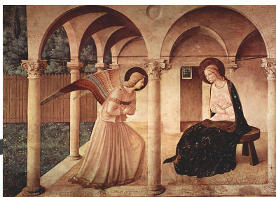
(b) „Zwiastowanie” Fra Angelico